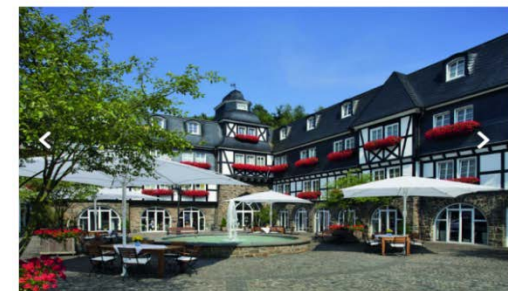
Romantik- & Wellnesshotel Deimann****

Naheres erfahren Sie unter www.invent-europe.com